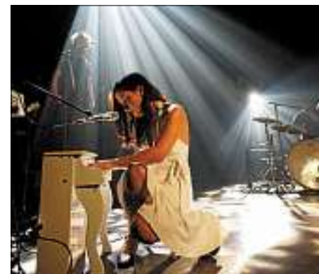
■ Miss White and The Drunken Piano.