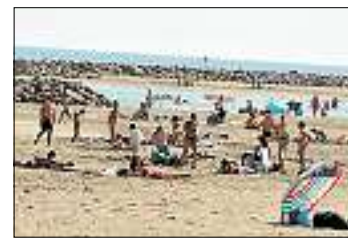
■ Eau fraîche, air chaud... Prudence en entrant dans la mer.

Les eaux étant froides, le risque d'hydrocution est fort, d'autant que la journée sera ensoleillée. Évitez donc de rentrer brusquement dans l'eau.