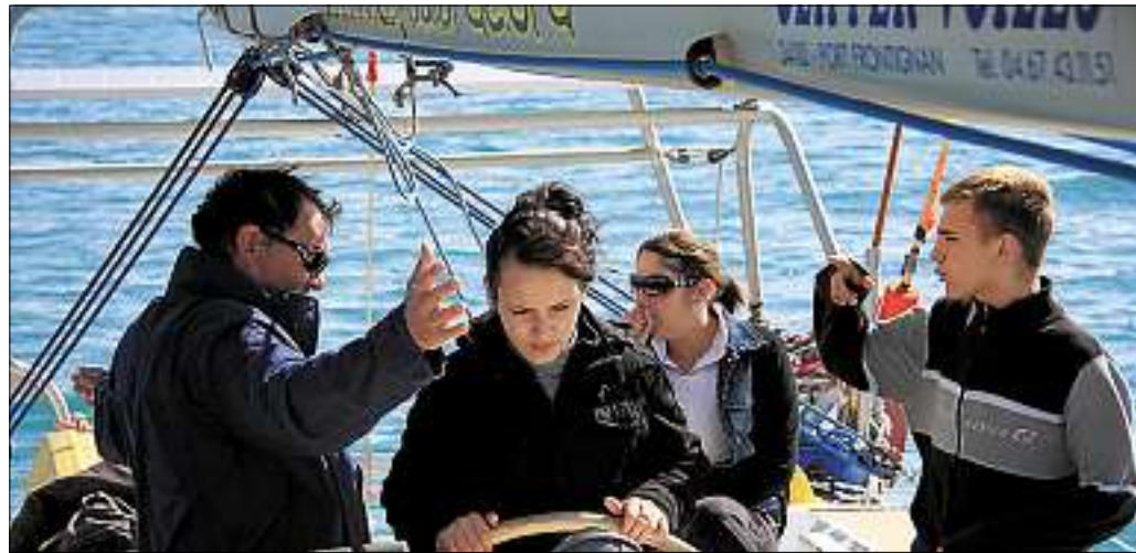
■ Cette 10 e édition du Festival de la jeunesse permettra d'engranger des fonds pour des sorties en mer.

Mer : peu agitée à agitée. Houle : non significative. Temps : beau temps ensoleillé. Visibilité : bonne.