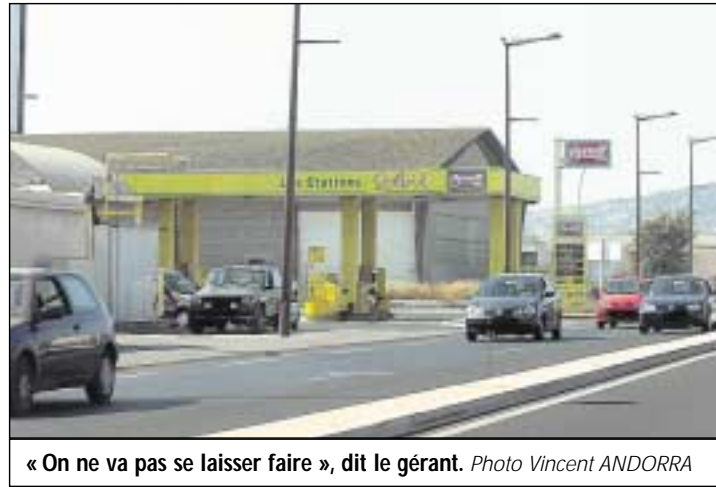
« On ne va pas se laisser faire », dit le gérant.