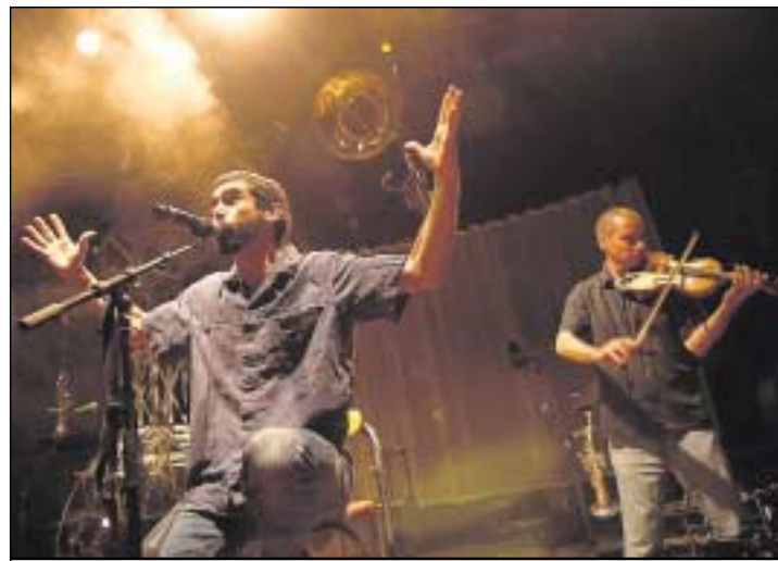
Les Ogres de Barback ont fait reculer - toutes - les barrières.

Le public sétois est venu en masse à l'image des adhérents de la carte Jeune à Sète et Kifo de Frontignan. Ils profitaient certes du demi-tarif sur un prix d'entrée déjà exceptionnel de 8 €, mais aussi un public venu de tout le bassin de Thau, de Montpellier même, et parfois de bien plus loin : Marseille, Toulouse, de Belgique... Ce concert était donné au profit de l'association Cap au large, qui a récol-