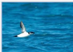
Pingouin torda

Avec moins de 50 couples uniquement localisés en Bretagne, le Pingouin torda est l'un des oiseaux marins les plus menacés de France. Les pingouins observés en Méditerranée arrivent de Grande-Bretagne et d'Irlande en Hiver.