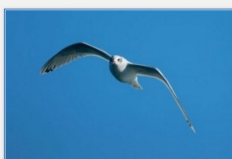
Mouette mélanocéphale

Partis au large de Sète à bord du voilier Laise Dire, quelques espèces marines nichant au bord des lagunes héraultaises ont pu être observées: Goéland leucophé bien sûr (Laridé le plus commun de la région), mais aussi Sterne caugek (dont les populations nicheuses françaises sont menacées, classées "vulnérables") et Mouette mélanocéphale, qui sont toutes deux intégrées dans le programme européen Life+ ENVOLL pour conserver les larimicoles méditerranéens.