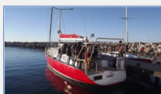
Le voilier Laise Dire au départ de Sète

La sortie en mer proposée par la LPO Hérault et l'association Cap au Large (membres du réseau CPIE-Bassin de Thau), initialement prévue pour les Journées Mondiales des Zones Humides, a finalement eu lieu ce samedi, du fait des mauvaises conditions météorologiques antérieures.