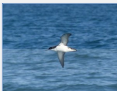
Puffin yellouan

Le Puffin yellouan est quant à lui endémique de Méditerranée, où il niche sur les îlots rocheux. En dehors de la reproduction, il peut parcourir de très longues distances et s'observe fréquemment dans le golfe du Lion.