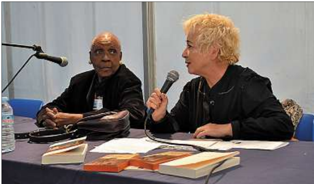
■ Tout en nuances et en malice, l'auteure de "Ségou" a répondu aux questions de Moni Grégo.

Automn'Halles | L'écrivain de 78 ans, née en Guadeloupe, invitée de marque du salon littéraire.