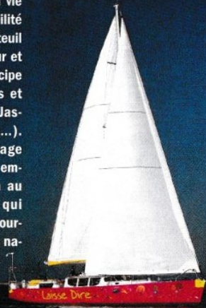
Le Laisse Dire a été aménagé afin de pouvoir constituer des équipages mixtes valides/handicapés.